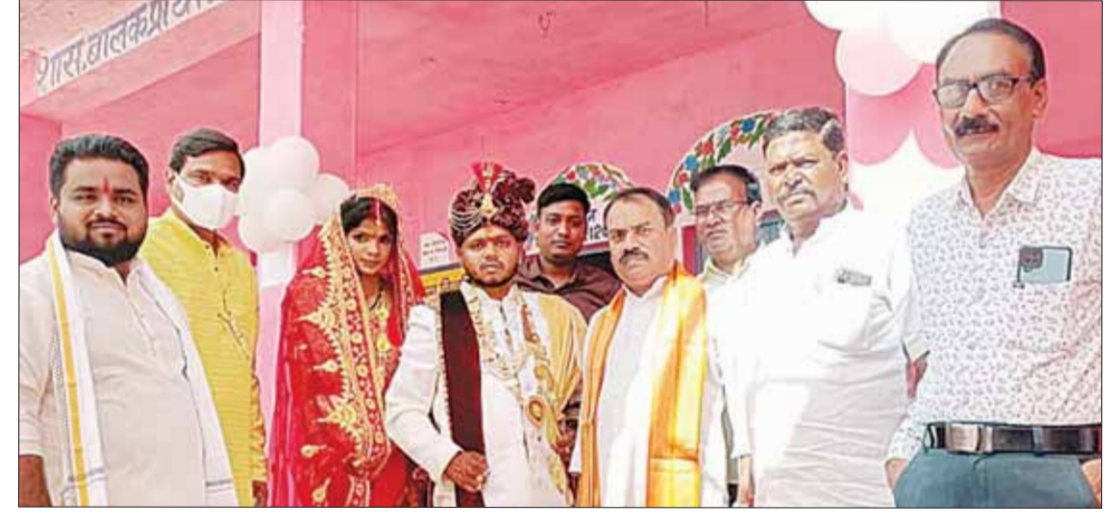
कटनी के अंबेडकर वार्ड में विवाह के मंडप से दूल्हा दुरहन मतदान करने पहुंचे।