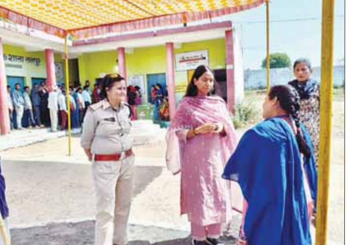
मतदान केंद्र पर निगमायुक्त निरीक्षण हुई